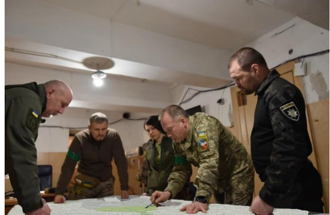
Нарада щодо звільнення Харківщини. Зліва направо: Юрій Лебідь – командувач Національної гвардії України, Роман Машовець – заступник керівника Офісу президента України, Ганна Маляр – заступниця міністра оборони України, Олександр Сирський – командувач Сухопутних військ ЗС України, Олександр Фацевич – заступник очільника Національної поліції.

29-30 квітня в результаті ведення наступальних дій вздовж траси Т21117 підрозділи 93-ї омбр вибили противника зі сіл Слатине та Прудянка. Для запобігання подальшому просуванню українських військ до кордону ворог почав нарощувати інженерно-фортифікаційне обладнання передових позицій у районі с.Козача Лопань. У травні бойові дії на цій ділянці фронту носили позиційний характер з незначним просуваннями Сил оборони України. Зокрема, 18 травня в ході наступу українські війська звільнили н.п. Дементіївка.