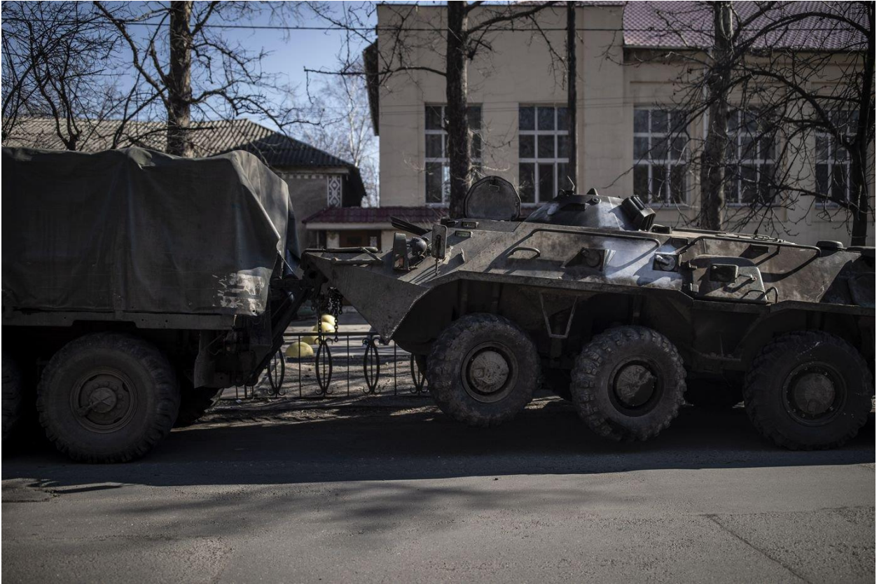
Вантажівка ЗС України буксирує захоплений російський БТР у Вознесенську.