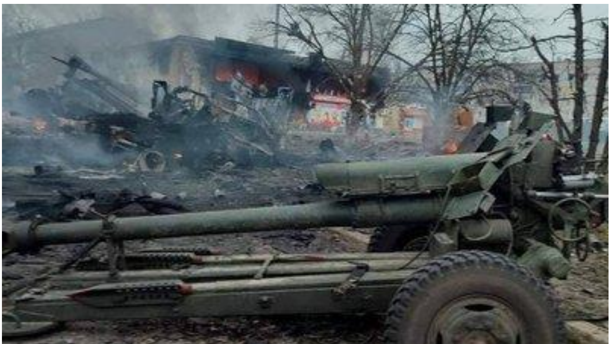
Розбита російська військова техніка в м. Баштанка.