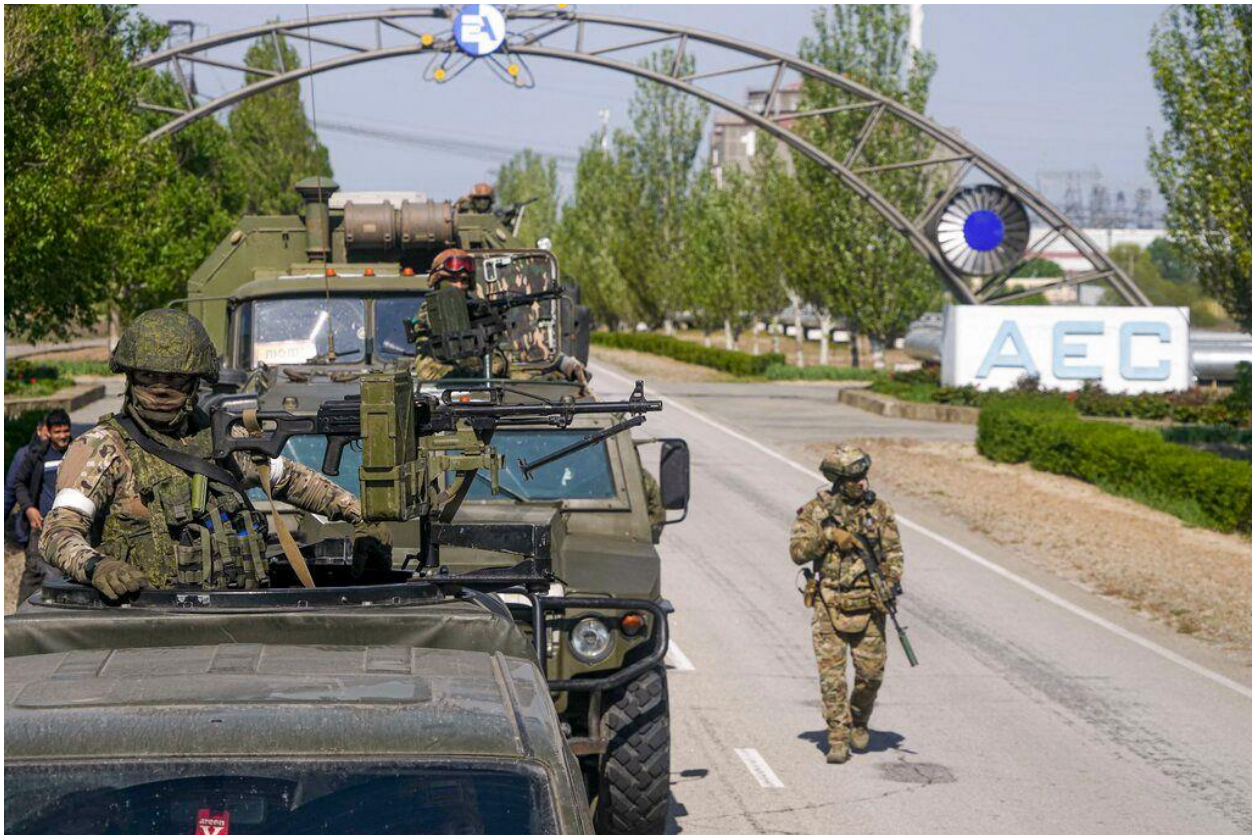
Російські окупанти коло Запорізької АЕС в м. Енергодар.

Паралельно з наступом в напрямку на Запоріжжя противник просувався до м. Енергодар і 27 лютого розпочав бої в околиці цього стратегічно важливого міста. О 9.00 4 березня територія Запорізької АЕС і м. Енергодар були захоплені противником, на територію АЕС введені підрозділи Росгвардії”.