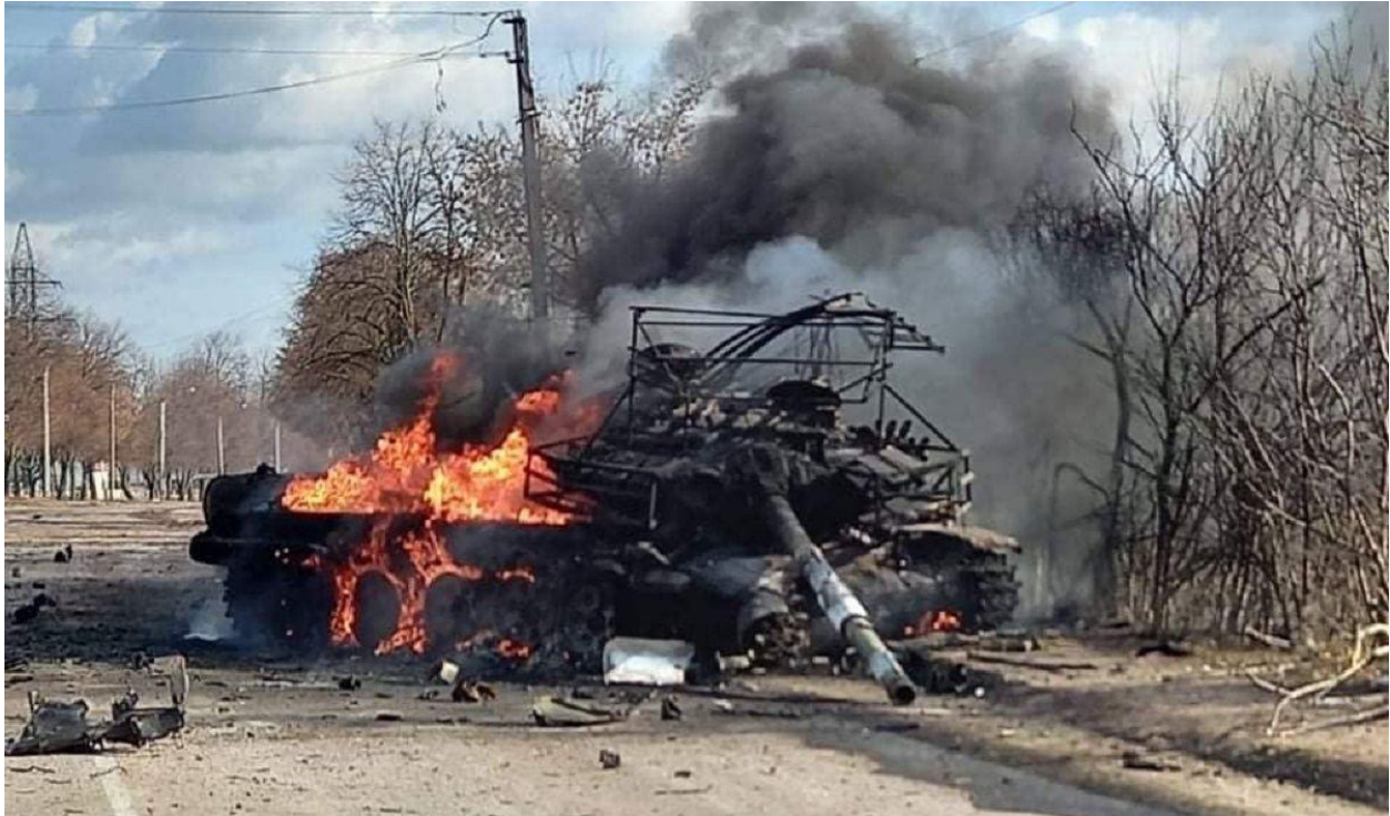
Російський танк знищений в передмісті Миколаєва.

підрозділи 28-ї омбр знищили катер противника й всю групу диверсантів. Того ж дня була зафіксована перша поява авангарду російських механізованих колон у передмістях Миколаєва. Два танки спробували “з ходу” зайти в обласний центр, але будучи обстріляними з боку захисників міста, втікаючи від переслідування, повернули в бік Херсону. Такої ж невдачі зазнав і перший масштабний наступ на Миколаїв 28 лютого – 2 березня.