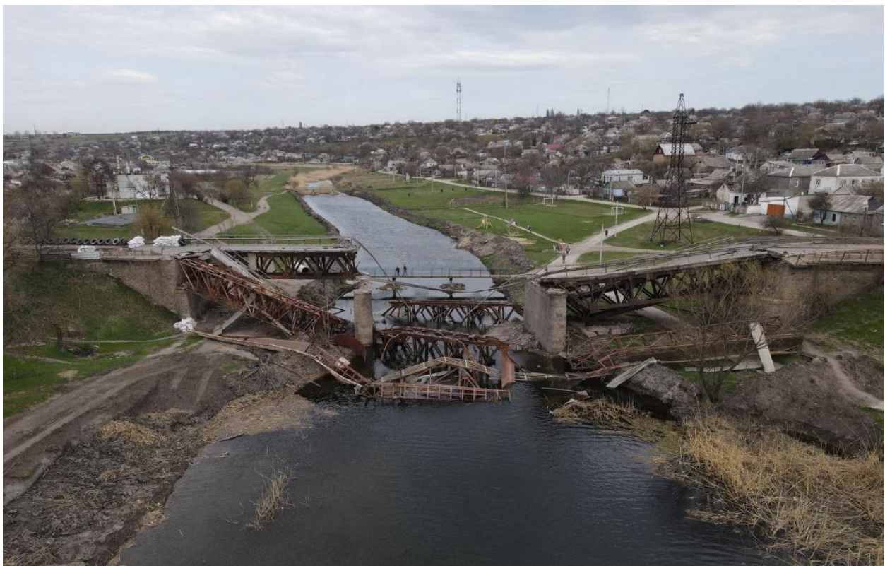
Знищений міст через р. Південний Буг у Вознесенську. 2 березня 2022 року.

28 лютого об 11 годині російські війська розпочали перший штурм м. Миколаїв. В наступ на обласний центр пішли основні сили противника, тоді як інші його підрозділи розпочали просування на північ до н.п. Вознесенськ і Первомайськ, з метою захопити основні переправи через р. Південний Буг. Перед командуванням Сил оборони України на південному напрямку постало питання: в якій місцевості (окрім Миколаєва) краще дати бій наступаючим підрозділам зс рф? Шукаючи відповідь на цей виклик, мною було віддано наказ офіцерам штабу – прорахувати відстань, яку російські механізовані підрозділи пройшли з Кримського перешийку та передбачити, в якій місцевості вони зіштовхнуться з проблемами браку пального і змушені будуть зупинитися, очікуючи підвезення паливно-мастильних матеріалів. Розрахунки показали, що це має трапитись на підходах до Вознесенська. Командиру 80-ї одшбр була визначена задача – зайняти район оборони на підступах до н.п. Вознесенськ, знищити залізничний і автомобільний мости через Південний Буг, а один утримувати до останньої можливості. Розрахунок виявився вірним – до 40 % техніки в російських підрозділах зупинилась на підступах до Вознесенська через вичерпання палива. Це залишило без підкріплення російських десантників, які висадились з вертольотів у н.п Андрійчикове і Яструбове на західному березі Південного Бугу, за 5 км і 2 км південніше від м. Вознесенська.