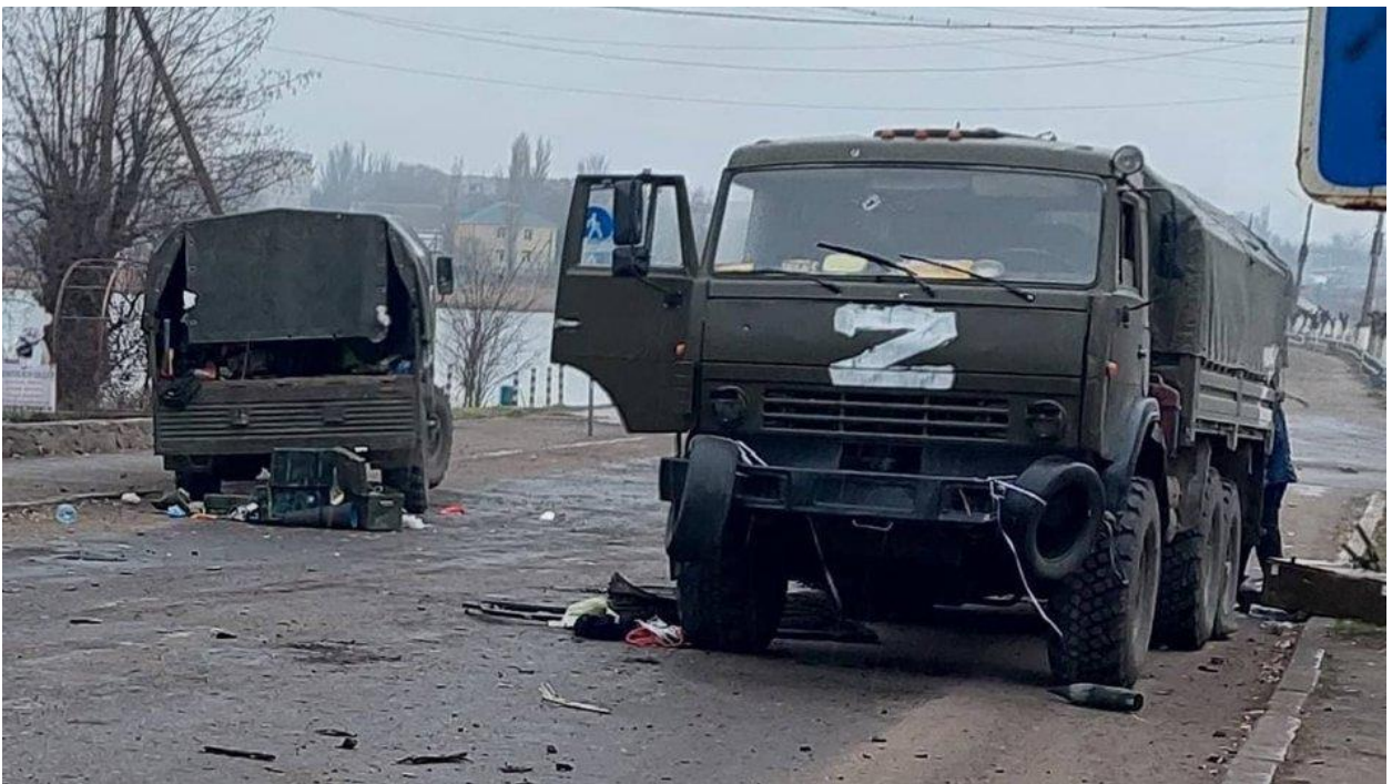
Російська техніка зупинена у Баштанці.

Противник намагався перейти в наступ на захисників міста, але, коли в російських солдатів полетіли гранати, вони швидко відступили. В момент, коли російські