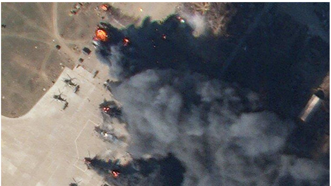
Російські гелікоптери, знищені 7 березня 2022 року українськими ракетними військами та артилерією на аеродромі Чорнобаївка. Ілюстративне фото з відкритих джерел. ( https://texty.org.ua/ )

Постійні невдачі в спробах захопити Миколаїв, падіння температури повітря до -10^{\circ}\text{C} , затяжні снігопади, відсутність логістичного забезпечення (підрозділи військ противника залишилися без теплого одягу та їжі) повністю деморалізували особовий склад агресора. В щоденному донесенні Інституту вивчення війни 11 березня сухо констатували: "...російські атаки на Миколаїв припинилися. (...) російські війська залишають багато транспортних засобів поблизу міста та деморалізовані через низькі температури й труднощі з постачанням". Наступного дня підрозділи зс рф під Миколаєвом почали окопуватись, готуючись до тривалої облоги, але вже 13 березня Сили оборони України перейшли в наступ. Війська противника, які впродовж понад двох тижнів намагалися просунутись до Миколаєва та Кривого Рогу були розбиті і змушені до 16 березня відійти в напрямку до адміністративної межі Херсонської області.