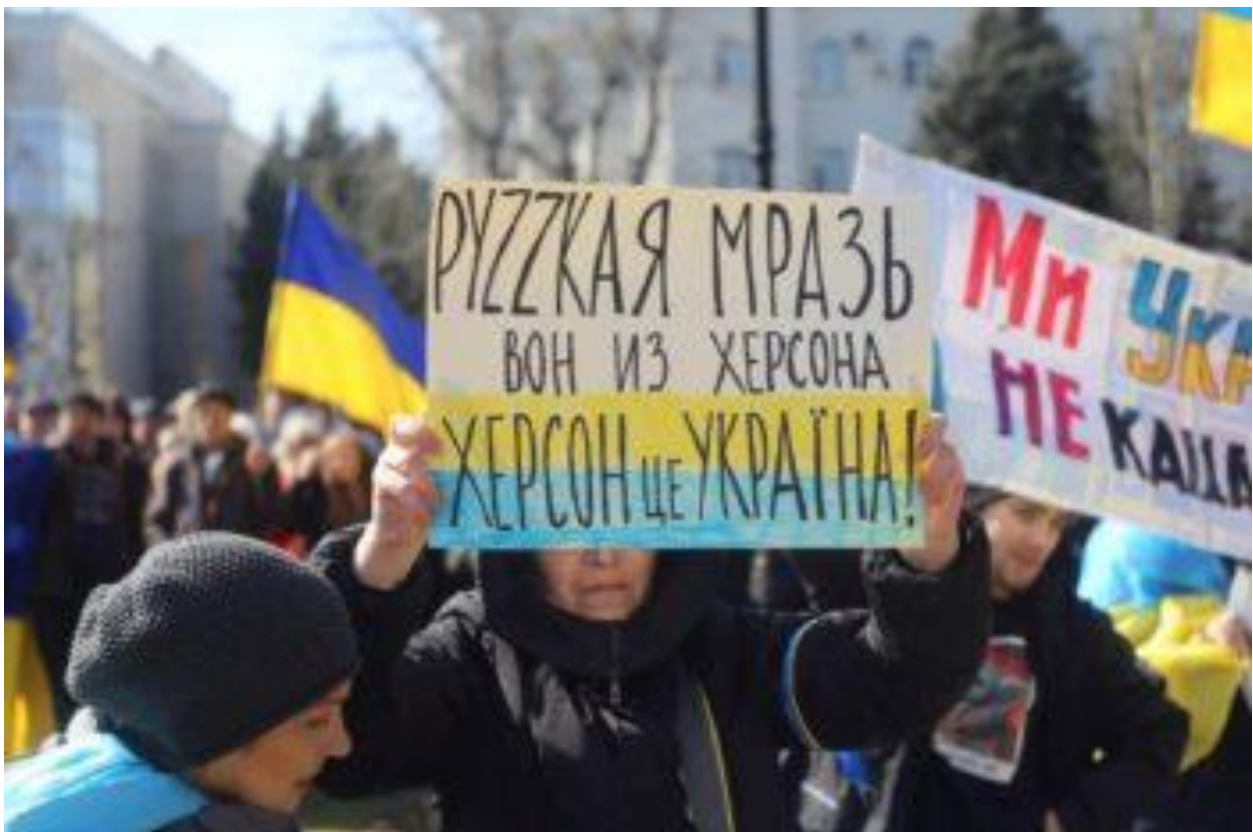
Херсонці протестують проти російської окупації. Ілюстративне фото з відкритих джерел. ( https://hromadske.radio/ )

Тоді ставало зрозуміло, що противник частиною сил планує нанести основний удар на Миколаїв, а частиною сил піти в напрямку Вознесенська, Первомайська і далі – на північ, з метою захопити мости через р. Південний Буг і пробити сухопутний коридор на Придністров'я.