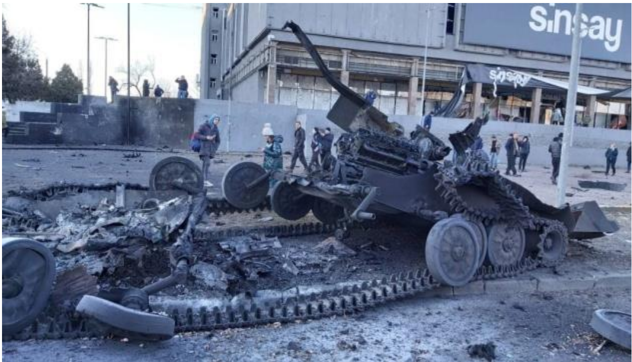
Знищена російська бронетехніка на околицях Миколаєва.

4 березня противник підтягнув до Миколаєва 15 БТГр зі складу 7-ї дшд зс рф і вивів у море десантні кораблі ЧФ рф, які зосередились за 40 км від порту Чорноморськ, неподалік Одеси. За задумом ворога, сухопутне угруповання мало заволодіти мостом через р. Південний Буг у Миколаєві, а після цього морський десант повинен був висадитись в Одеській області й оволодіти портом Чорноморськ. Проте, Командування Сил оборони України на південному напрямку вважало, що загроза висадки морського десанту противником не обмежується до одного порту Чорноморська, а охоплює територію від Одеси до Очакова. А це змушувало пильно спостерігати за всією територією й бути завжди готовим до появи неприятеля з боку моря, адже впродовж перших днів березня російське корабельне угруповання проводило обстріл урізу води з метою розмінувати проходи до берега, необхідні для десантування. І тоді була найбільш загрозна ситуація – одночасної атаки з повітря, з моря і з суходолу. Лише наші рішучі дії та наказ нанести вогневе ураження про російських кораблях із РСЗВ, змусило противника відійти від українського узбережжя. Упродовж трьох наступних тижнів висадку морського десанту сковували складні погодні умови. Російських морських піхотинців захитала хитавиця. Вони почали хворіти на морську хворобу. Особовий склад втратив боєздатність, морально-психологічний клімат погіршився, почались бунти, невдоволення і їх евакуювали на берег.